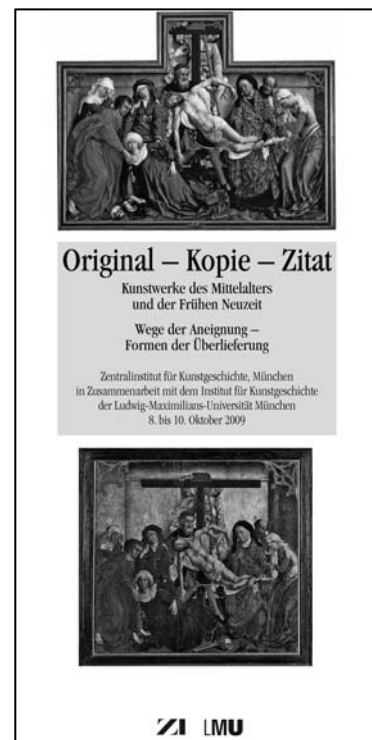
Tagungsprogramm, oben: Rogier van der Weyden, Kreuzabnahme (Madrid, Museo del Prado); unten: Kopie nach Rogier van der Weyden, (Löwen, St. Peter); © ZI