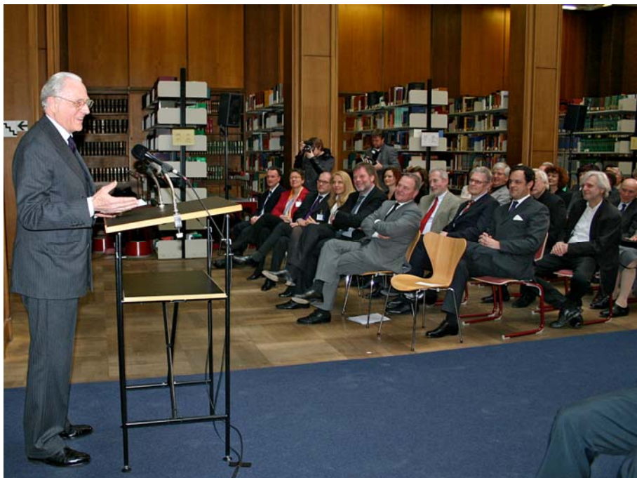
Grußwort von Herzog Franz von Bayern zur Übergabe seiner Bibliothek zur Kunst der Moderne an das Zentralinstitut für Kunstgeschichte; © ZI/Behrens