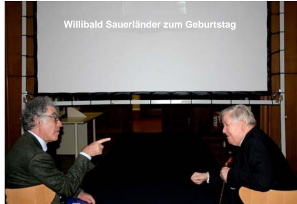
Carlo Ginzburg (links) und Willibald Sauerländer am 28.2. im großen Lesesaal der Bibliothek

Anlässlich des 85. Geburtstags von Willibald Sauerländer lud das Zentralinstitut für Kunstgeschichte am 28. Februar zu einer Feier in den großen Lesesaal der Bibliothek des Zentralinstituts ein. Der Festvortrag wurde von Carlo Ginzburg zum Thema „David, Marat – Art Politics Religion“ gehalten.