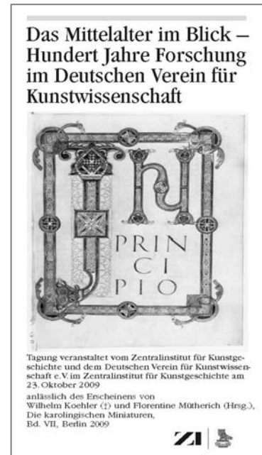
Tagungsprogramm, Paris, Bibliothèque Nationale de France, ms. lat. 2 (Bibel), fol. 11a ; © ZI/Behrens