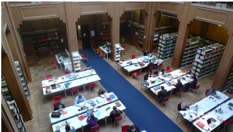
Großer Lesesaal des Zentralinstituts für Kunstgeschichte mit neuer Möblierung

Das Bayerische Staatsministerium für Wissenschaft, Forschung und Kunst hat dem ZI ermöglicht, das fast fünfundzwanzig Jahre alte, verbrauchte Lesesaalmobiliar zu erneuern, beginnend 2009 mit der Ende September erfolgten Neumöblierung des großen Lesesaals.