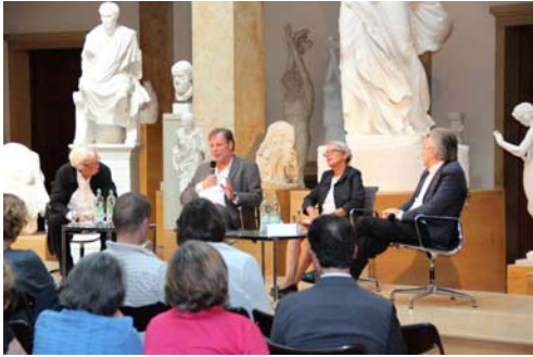
Round-Table am 12.07.2013

Internet, Foto, Video und Fernsehen abzielen scheint. Sie ist nolens volens stets auf einen städtebaulichen oder regionalen Kontext bezogen. Die Wahl des Materials, die Entscheidung für oder gegen Konstruktions- und Bauformen wie auch die funktionalen Anforderungen an die einzelnen Bauten sind immer auch durch den Standort mitgeprägt. Zugleich stehen diese besonderen Konstellationen vor Ort in einem Spannungsfeld zur wachsenden Standardisierung der Bauprozesse und Bautechniken sowie zur globalen Verfügbarkeit der Baumaterialien.