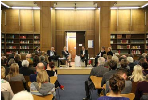
Round-Table am 22.11.2013

„Kunst und Wissenschaft, Forschung und Lehre sind frei“ – und finden doch stets in engster Vernetzung mit Institutionen und deren positiven wie negativen ‚Bedingungen‘ statt.