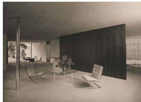
Haus auf der Bauausstellung, Berlin, 1931, © VG Bild-Kunst

Der Catalogue raisonné wird als Printpublikation erscheinen. Die Forschungsergebnisse werden im Laufe des Projekts online zugänglich gemacht; das dabei eingesetzte Redaktionstool soll zugleich einem größeren Fachpublikum als Diskussionsplattform dienen.